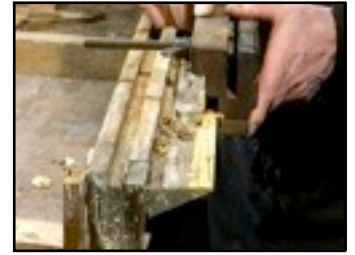
Im Rahmen der Denkmalpflege werden traditionelle Handwerkstechniken mit traditionellen Materialien verarbeitet. Die Wassernut wird mit einem Nuthobel am reparierten Wetterschenkel erneuert.

Die Fensterhandwerker haben das Wissen zunächst in Schweden von alten Handwerkern und aus historischen Manualen und überlieferten Rezepturen zusammengetragen und in der Praxis das überlieferte Wissen und Können wieder zum Leben erweckt, auch in Deutschland.