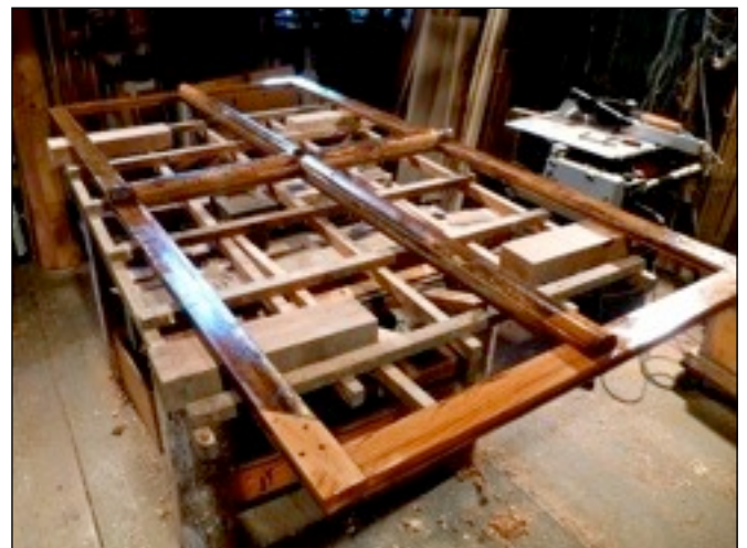
Nach Entfernung aller substanzschädigenden Beschichtungen und nach Holzreparaturen (mit historischem Holz) an diesem Blendrahm eines Kreuzstockfensters von 1776 wurde die ursprüngliche Konservierung mit rohem und gekochtem Leinöl wiederhergestellt. Im eingebauten Zustand ist die Konservierung nur an den zugänglichen Stellen möglich und nötig.

Historische Fenster mit Einfachverglasung haben im traditionellen Massivbau die Aufgabe als „Sollkondensator“ die überschüssige Feuchtigkeit aus dem Raum zu sammeln und eventuell nach aussen abzuführen. Das somit an der Innenseite der Fensterscheiben anfallende Schwitzwasser beansprucht besonders die Wetterschenkel und ihre Kittbetten. Diese empfindlichen Stellen der Fensterflügel können