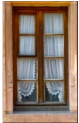
Die Leinölkonservierung an diesem historischen Fenster in Hambach (Pfalz) wurde 50 Jahre lang nicht mehr gepflegt. Dennoch hat das Holz keinen Schaden genommen.

Darüber hinaus konnten Produkte auf dem Markt erscheinen, die von ihren Herstellern als „Leinölfarbe“ bezeichnet werden, deren Eigenschaften aber mit denen von Leinöl und Leinölfarbe nichts mehr zu tun haben. Auch hinter der Bezeichnung „auf Leinölbasis“ verstecken sich meistens schichtbildende Mischprodukte, die zur Irreführung des Anwenders beitragen. Oft wird diese Bezeichnung aus Unkenntnis des ursprünglichen Zwecks von Leinöl verwendet.