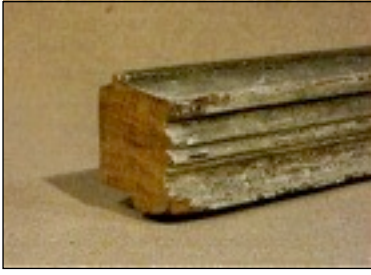
Die traditionelle Konservierung mit Leinöl an diesem unteren Rahmenholz eines historischen Fensters wurde vernachlässigt, ohne dass die Holzsubstanz Schaden genommen hat.

wussten, dass Leinölfarbe einen dauerhafteren Wetterschutz an Fenstern bietet als jede schichtbildende Farbe. Während Leinöl ohne Schichten zu bilden weit eindringt und damit das Holz schützt, können Beschichtungen reißen und Feuchtigkeit eintreten lassen. Nach dem Überstreichen der Risse wiederum mit einer Beschichtung beschleunigt sich durch die eingeschlossene Feuchtigkeit die Zerstörung der Holzsubstanz.