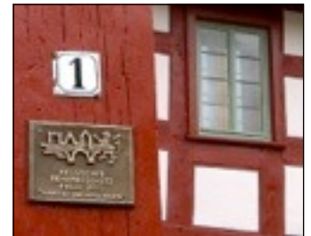
Wiederhergestellte Konservierung mit Leinöl und Leinölfarbe an Fachwerk und Fenster. Hessischer Denkmalschutzpreis 2010.

Für Maler im Handwerk galt auch nach dem Zweiten Weltkrieg die Regel „Leinölfarbe ist Fensterfarbe“, weil auch nach dem Aufkommen des schichtbildenden und schnell trocknenden Alkydharzlacks Maler