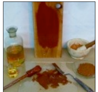
Leinölfarbe entsteht durch das Verreiben des konservierenden Bindemittels gekochtes Leinöl mit dem Farbmittel Erdfarbe oder Pigment. 0,1 bis 3 % Trockenstoffe werden hinzugefügt.