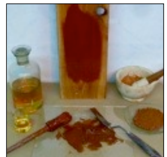
Leinölfarbe entsteht durch das Verreiben des konservierenden Bindemittels gekochtes Leinöl mit dem Farbmittel Erdfarbe oder Pigment. 0,1 bis 3 % Trockenstoffe werden hinzugefügt.